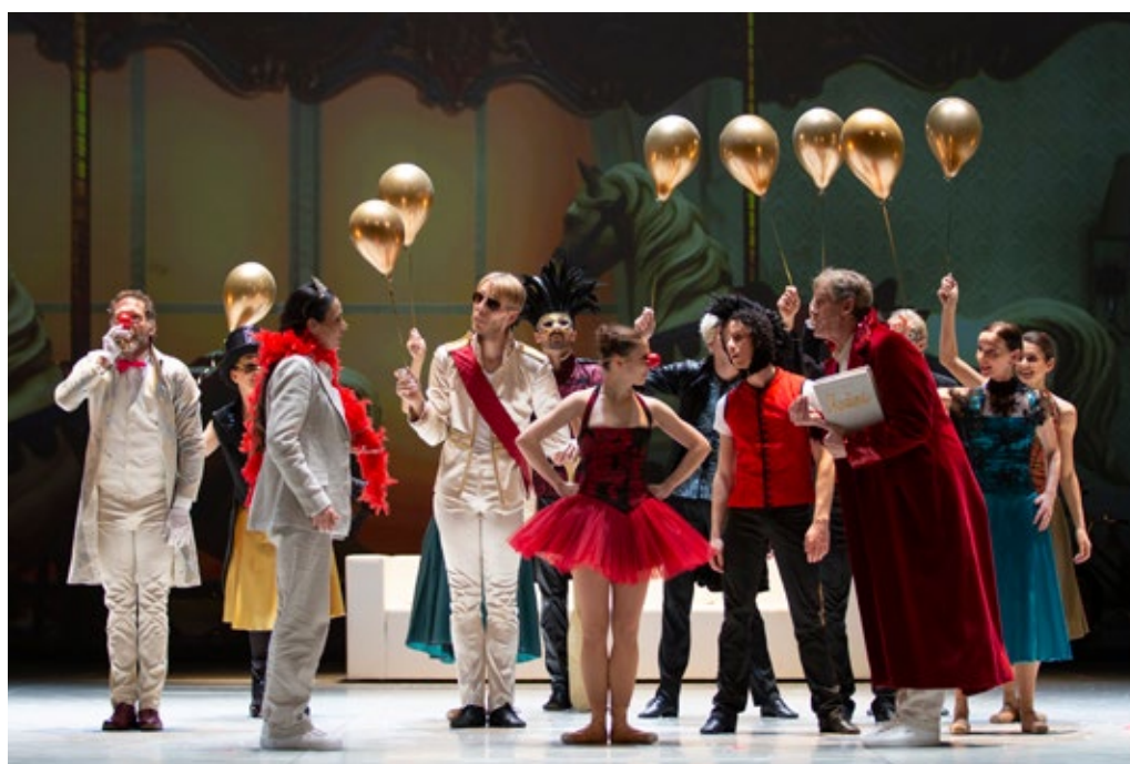
»/.../ v tem je ves čar, a tudi zapreka: vse odvisi samo od človeka.«