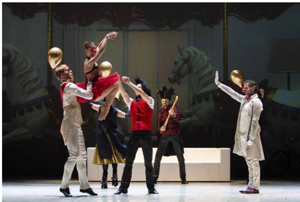
Čindrasa, čindrasa.

Med ogledom spremljajte tudi video vsebine v ozadju. Bodite pozorni na motive, slog in povezavo z drugimi uprizoritvenimi elementi.