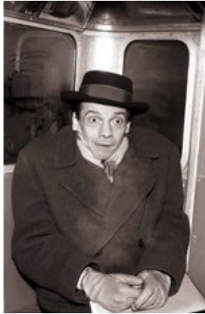
Prvič s pohorsko vzpenjačo, 10. 2. 1959 dopoldne.