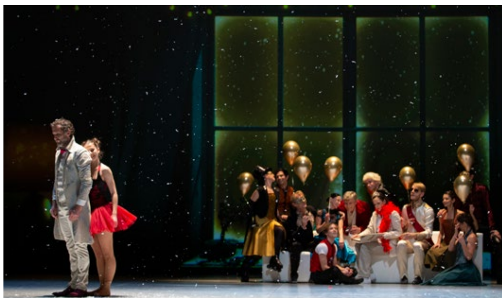
Tako gre na sveti brez konca in kraja.

družina • ljubezen • rojstvo • odraščanje • minevanje narava • radovednost • domišljija • varnost