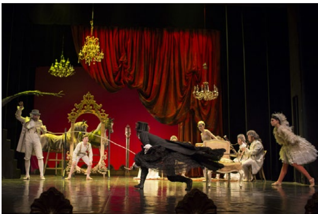
Kaj bi bilo, če bi volk ...

Kaj bi se zgodilo z junaki, če Petru, živalskim pomočnikom in lovcema ne bi uspelo volka spraviti v živalski vrt? Otroke spodbudimo, da si zamislijo čim več možnosti, kako bi se lahko zgodba končala. Spremenjeno zgodbo zapišejo, jo narišejo ali pa jo odigrajo.