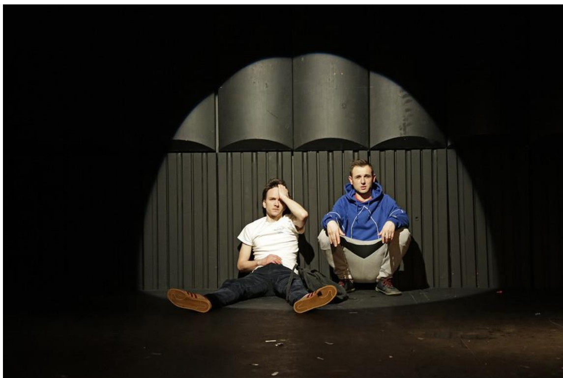
Prijateljska podpora.