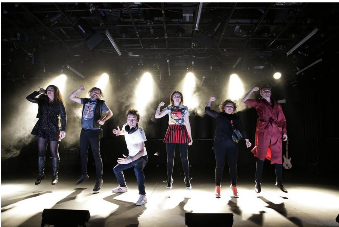
Razširjena družina Škorc v »luftu«.